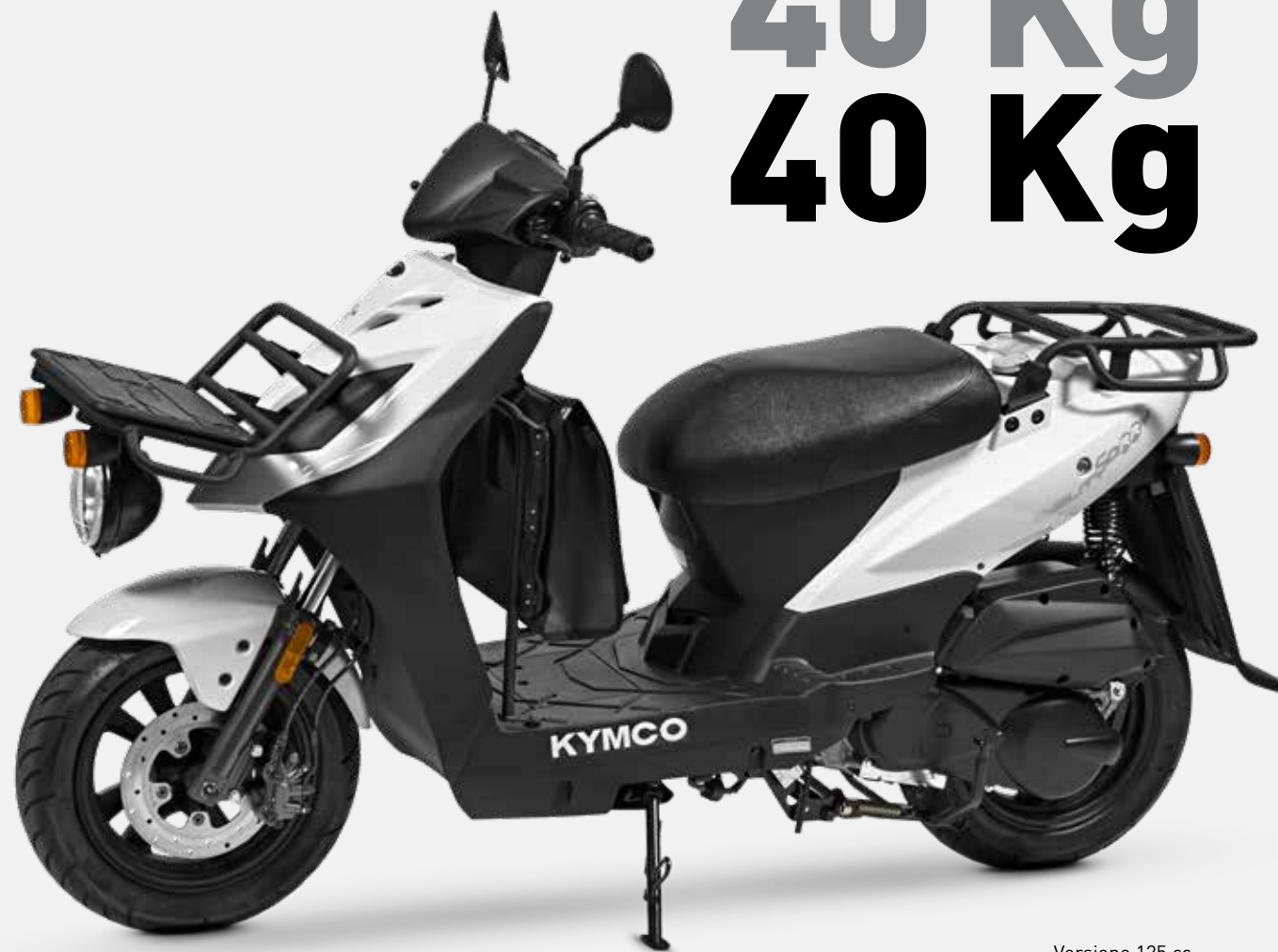
Versione 125 cc