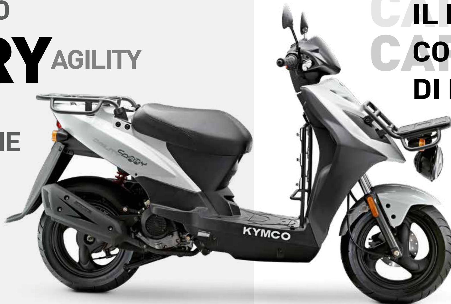
Versione 50 cc