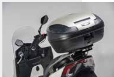
BAULETTO 47 LITRI IN TINTA