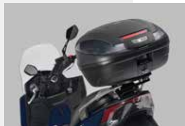
BAULETTO 47 LITRI GOFFRATO