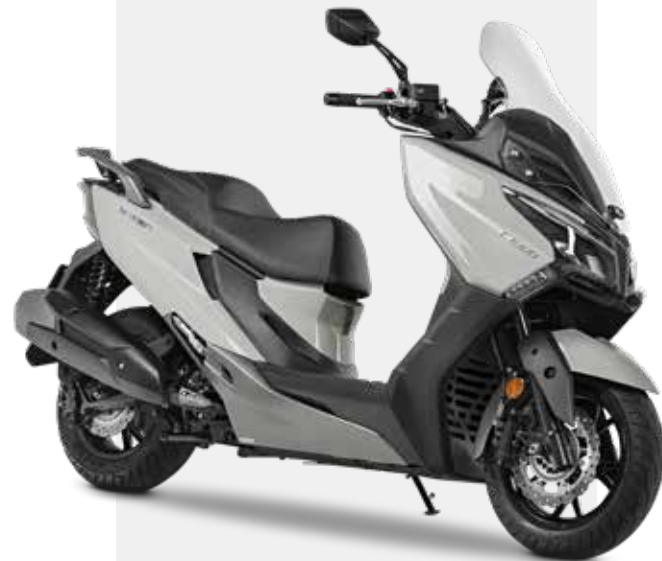
GRIGIO DOSSENA 300