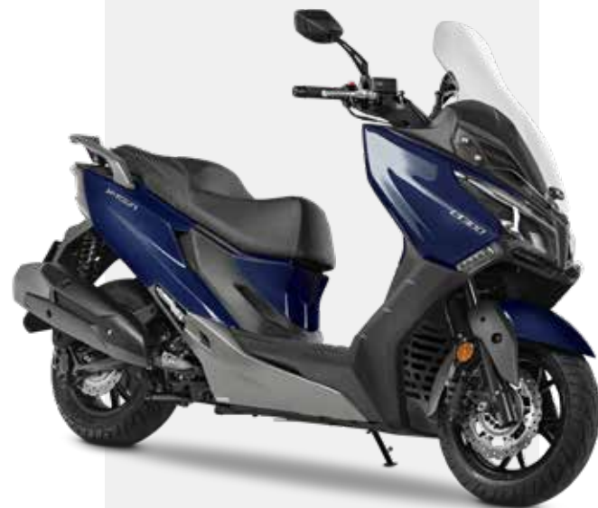
BLU GARDA 125-300